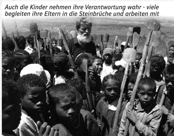
Auch die Kinder nehmen ihre Verantwortung wahr - viele begleiten ihre Eltern in die Steinbrüche und arbeiten mit