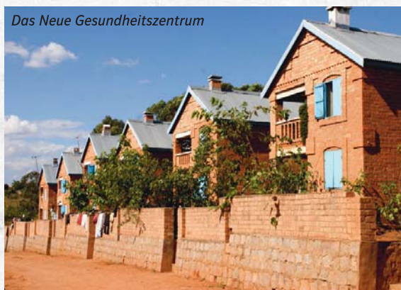
Das Neue Gesundheitszentrum