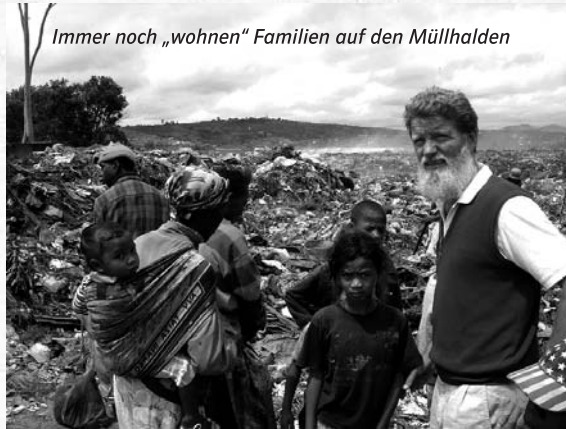
Immer noch „wohnen“ Familien auf den Müllhalden